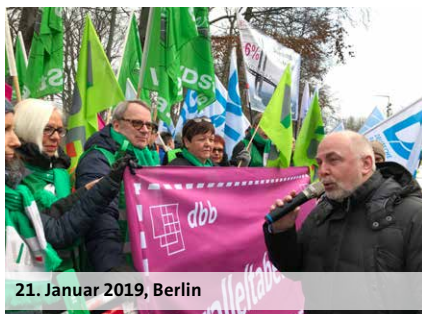
21. Januar 2019, Berlin