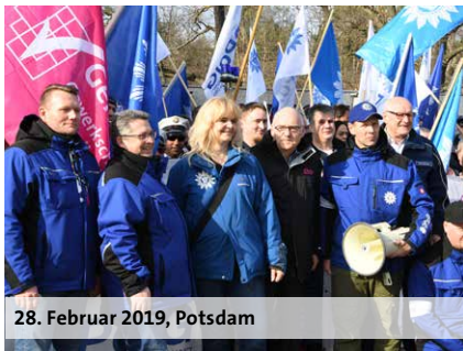
28. Februar 2019, Potsdam