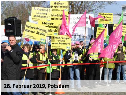
28. Februar 2019, Potsdam