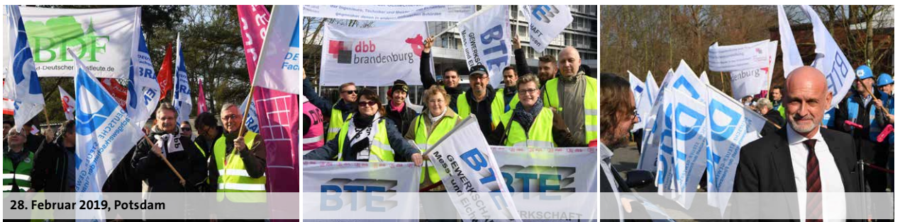
28. Februar 2019, Potsdam

Die lineare Steigerung beträgt im Gesamtvolumen 3,2 % (mindestens 100 Euro) zum 1. Januar 2019, nochmals 3,2 % (mindestens 90 Euro) zum 1. Januar 2020 und schließlich 1,4 % (mindestens 50 Euro) zum 1. Januar 2021. Dabei wird die jeweilige Stufe 1 in der Tabelle überproportional erhöht. Das ergibt unter Einberechnung aller weiteren Faktoren der Tarifeinigung ein Gesamtvolumen von 8 %. Die Laufzeit beträgt 33 Monate (bis 30. September 2021).