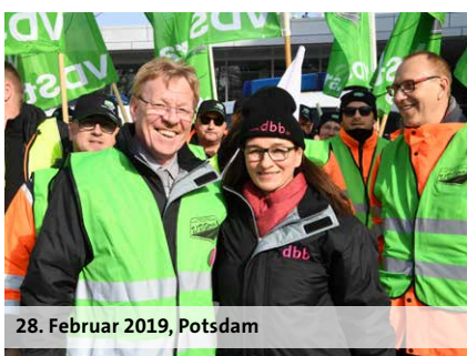
28. Februar 2019, Potsdam