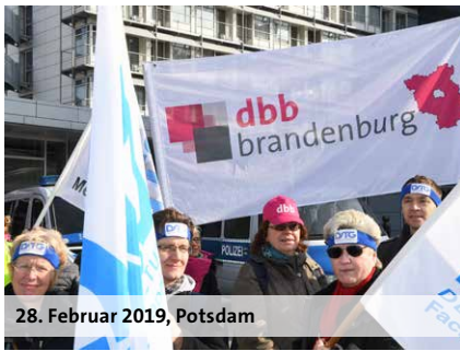
28. Februar 2019, Potsdam