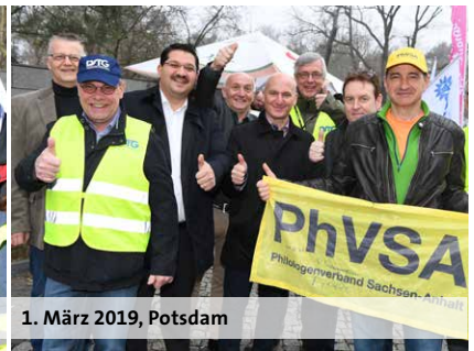
1. März 2019, Potsdam