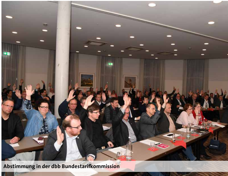
Abstimmung in der dbb Bundestarifkommission