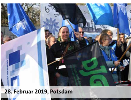
28. Februar 2019, Potsdam

Die Angleichungszulage wird zum 1. Januar 2019 von bisher 30 Euro um 75 Euro auf 105 Euro erhöht. Auch in der nächsten Einkommensrunde werden weitere Angleichungsschritte verhandelt. Schon nach Abschluss der aktuellen Einkommensrunde wollen die Tarifpartner wieder über die Weiterentwicklung der Entgeltordnung für Lehrkräfte reden.