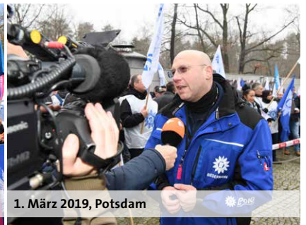
1. März 2019, Potsdam